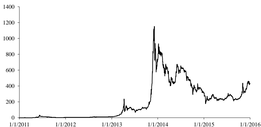
Рис. 2. Динамика стоимости биткойна к доллару США, долл. США за 1 биткойн

На сегодняшний день в обращении находится более 15 млн биткойнов. Цена одного биткойна за 4 месяца 2016 года колебалась в пределах 400–460 долларов США (см. рис. 2). Таким образом, совокупная стоимость всех выпущенных биткойнов составляет около 7 млрд долларов США.