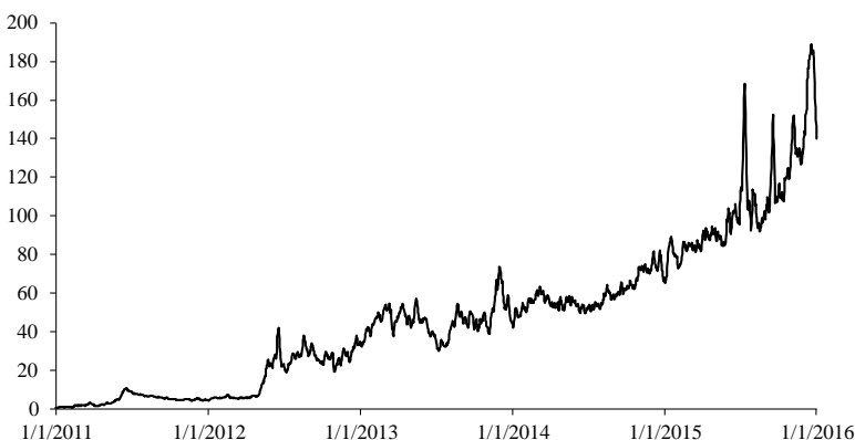
Рис. 4. Динамика числа транзакций в сети Биткойн с 01.01.2011 по 31.12.2015, тыс. транзакций/день