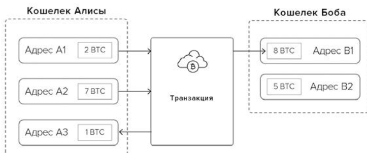
Рис. 1. Транзакция в сети Биткойн

Субъекты участвуют в транзакциях в сети Биткойн посредством набора биткойн-адресов, называемых кошельком (набор биткойн-адресов, принадлежащих одному лицу). Каждая запись транзакции включает один или несколько адресов отправки ( входов ) и один или несколько адресов получения ( выходов ), а также сведения о том, сколько каждый из этих адресов отправил и получил. Пример транзакции представлен на рис. 1.